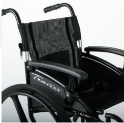
TRAVIXX COMFORT LITE PLUS | FOTO 32