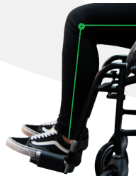
TRAVIXX COMFORT LITE PLUS | FOTO 24