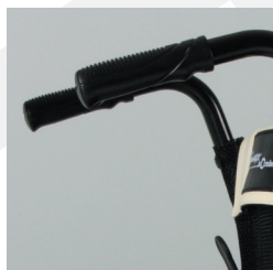
TRAVIXX COMFORT LITE PLUS | FOTO 6

De duwhandvatten van de Travixx Comfort Lite Plus zijn ergonomisch gevormd (foto 6). Dit betekent dat uw begeleider goede grip heeft op de duwhandvatten. Hierdoor wordt het voortduwen voor de begeleider niet alleen comfortabeler, maar is de rolstoel ook veiliger voort te duwen.