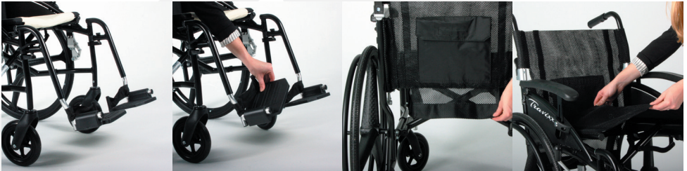
TRAVIXX COMFORT LITE PLUS | FOTO 1 TRAVIXX COMFORT LITE PLUS | FOTO 2 TRAVIXX COMFORT LITE PLUS | FOTO 3 TRAVIXX COMFORT LITE PLUS | FOTO 4