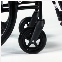
TRAVIXX COMFORT LITE PLUS | FOTO 28

De voorwielen van de rolstoel zijn 7" groot en door middel van een voorvork aan het frame van de rolstoel bevestigd (foto 28). De voorwielen zijn belangrijk bij het sturen van de rolstoel. Wanneer het sturen niet soepel gaat of de voorwielen trillen, zijn de voorwielen niet goed in- en/of afgesteld.