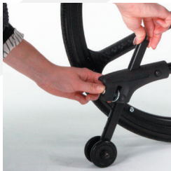
TRAVIXX COMFORT LITE PLUS | FOTO 27