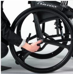
TRAVIXX COMFORT LITE PLUS | FOTO 34

Als u de rolstoel opgevouwen gaat vervoeren in uw auto dient u er zeker van te zijn dat de rolstoel op zijn plaats blijft liggen. Dit kunt u doen door de rolstoel vast te maken. Hiervoor zijn onder andere taxifixatiepunten aanwezig op de rolstoel. Deze zijn aangegeven met stickers met een haaksymbool (foto 38) en geven aan dat dit de punten zijn waarop de rolstoel gefixeerd kan worden door middel van een goedgekeurd veilig taxifixatiesysteem (aanwezig in voertuigen ingericht op vervoer van mensen met een mobiliteits beperking, zoals bijv. een zorgtaxi bus).