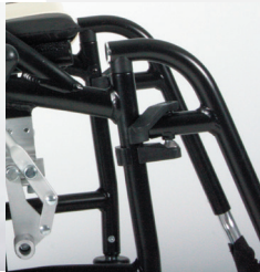
TRAVIXX COMFORT LITE PLUS | FOTO 16