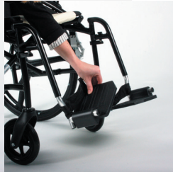
TRAVIXX COMFORT LITE PLUS | FOTO 21