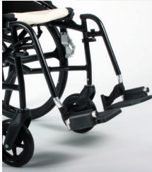
TRAVIXX COMFORT LITE PLUS | FOTO 20