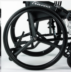
TRAVIXX COMFORT LITE PLUS | FOTO 35