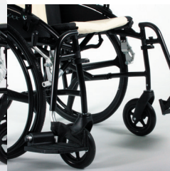
TRAVIXX COMFORT LITE PLUS | FOTO 36