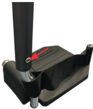
TRAVIXX COMFORT LITE PLUS | FOTO 22

Het is ook mogelijk om de voetplaten in hoogte te verstellen. Hier heeft u echter wel een inbussleutel voor nodig. Aan de achterkant van de stang van de beensteun bevindt zich een schroef (foto 22) die u met behulp van een inbussleutel kunt verwijderen. Vervolgens kan de binnenstang met de voetplaat omhoog of omlaag geschoven worden. Zorg dat de gaatjes van de binnenstang en buitenstang elkaar overlappen. U kunt nu de schroef terugplaatsen en weer aandraaien met de inbussleutel. De voetplaten hebben op de laagste stand nog altijd een bodemvrijheid van 7 cm (foto 23). Let er bij het in hoogte verstellen van de voetplaten op dat de knie van de inzittende nooit naar boven wijst, maar stel de hoogte zo in, dat het bovenbeen nagenoeg horizontaal ligt (foto 24). Dit is de meest comfortabele zitpositie.