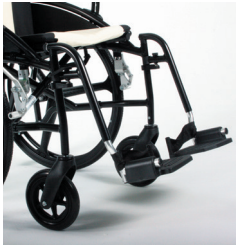
TRAVIXX COMFORT LITE PLUS | FOTO 15