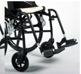
TRAVIXX COMFORT LITE PLUS | FOTO 37