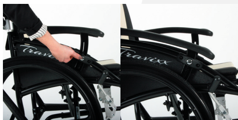
TRAVIXX COMFORT LITE PLUS | FOTO 7 TRAVIXX COMFORT LITE PLUS | FOTO 8