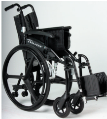
TRAVIXX COMFORT LITE PLUS | FOTO 5