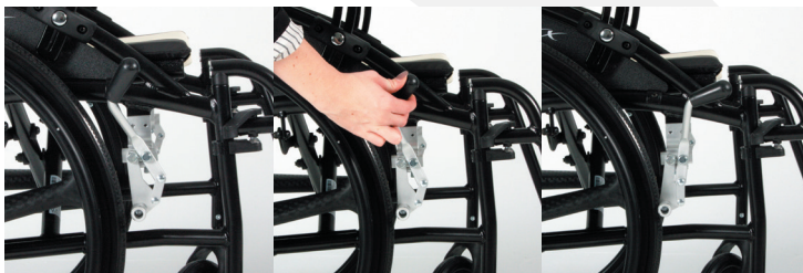
TRAVIXX COMFORT LITE PLUS | FOTO 12