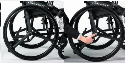
TRAVIXX COMFORT LITE PLUS | FOTO 29