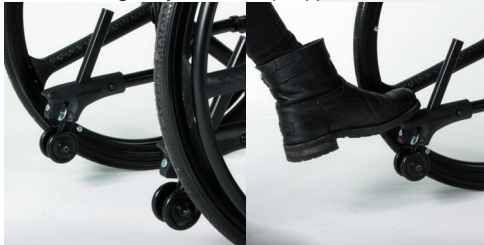
TRAVIXX COMFORT LITE PLUS | FOTO 25

De Travixx Comfort Lite Plus is uitgerust met twee anti-tip wielen inclusief trapdoppen (foto 25). De anti-tip wielen voorkomen dat uw rolstoel achterover kiept. Wanneer u bijvoorbeeld een stoep of verhoging op moet, zorgen de anti-tip wielen voor een extra steunpunt op de ondergrond waarop u rijdt. De trapdoppen kunnen gebruikt worden door de begeleider om met de voet extra kracht te zetten door naar beneden te duwen om de rolstoel iets achterover te kantelen wanneer er een verhoging moet worden overgegaan met de rolstoel (foto 26). U dient echter wel voorzichtig te zijn met de trapdoppen wanneer u hier gebruik van maakt.