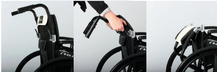
TRAVIXX COMFORT LITE PLUS | FOTO 9

De rugleuning van de Travixx Comfort Lite Plus (foto 9) is bevestigd aan de buizen van de duwhandvatten. De rugleuning is half neerklapbaar. Knijp hiervoor met beide handen de hendels aan weerszijden in en vouw de rugleuning achterover, zoals op foto 10 is weergegeven. Om de rugleuning weer terug op te klappen, dient u beide zitbuizen tegelijk weer omhoog te bewegen totdat beide scharnieren terug vastklikken.