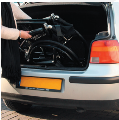
TRAVIXX COMFORT LITE PLUS | FOTO 33