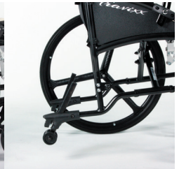
TRAVIXX COMFORT LITE PLUS | FOTO 30