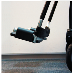
TRAVIXX COMFORT LITE PLUS | FOTO 23