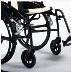
TRAVIXX COMFORT LITE PLUS | FOTO 19