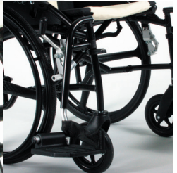
TRAVIXX COMFORT LITE PLUS | FOTO 18