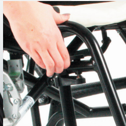
TRAVIXX COMFORT LITE PLUS | FOTO 17